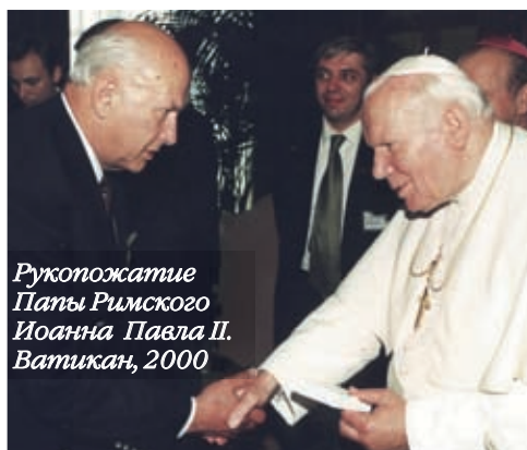
Рукопожатие Папы Римского Иоанна Павла II. Ватикан, 2000