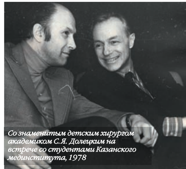
Со знаменитым детским хирургом академиком С. Я. Долецким на встрече со студентами Казанского мединститута, 1978