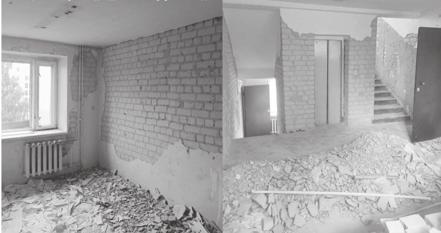
📷 В общежитии произведен демонтаж внутренней отделки жилых помещений и мест общего пользования

дерального бюджета. Однако, после того, как было получено заключение о соответствии сметной стоимости проведения капитального ремонта именно по 5 общежитию, в начале 2021 года произошел галопирующий рост цен на строительные материалы. В настоящее время дефицит оценивается примерно в 20-30 процентов. На ремонт уже выделено 203 миллиона рублей, но, если учитывать реальные цены, какими они были на конец 2 квартала текущего года, ремонт общежития оценивается уже в 238 миллионов рублей. «Мы очень надеемся на то, что на правительственном уровне будет разработан и принят механизм по изменению стоимости заключенных государственных контрактов на проведение работ по капитальному ремонту», – комментирует ситуацию Айдар Ильдарович.