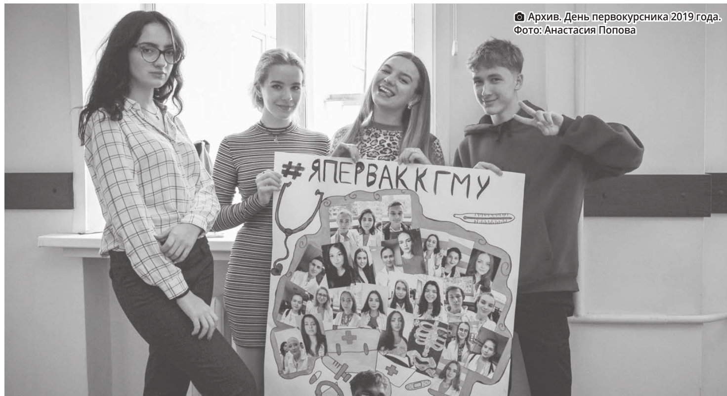
☑ Архив. День первокурсника 2019 года.

Традиционный праздник студентов первого курса Казанского государственного медицинского университета в этом году проводится в онлайн-режиме. 748 новоиспеченных студентов готовятся к первому масштабному празднику в университете. Несмотря на то, что мероприятия, посвященные Дню первокурсника, в этом году проводятся не в традиционном формате, организаторам удалось сохранить традиционные конкурсы: на лучшую стенгазету и лучшую видеопрезентацию своей группы.