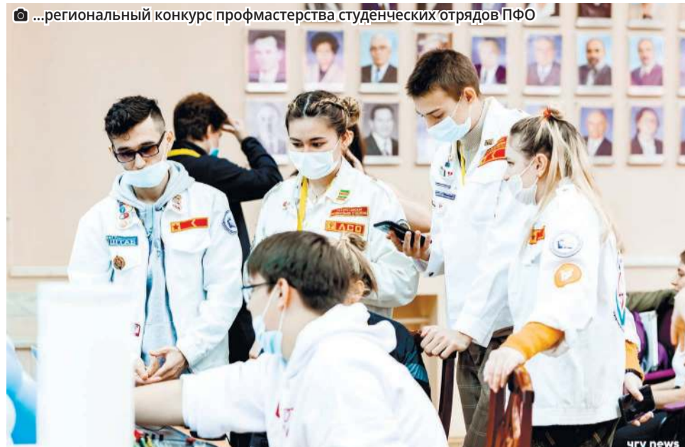
...региональный конкурс профмастерства студенческих отрядов ПФО