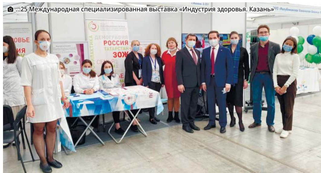
...25 Международная специализированная выставка «Индустрия здоровья. Казань»