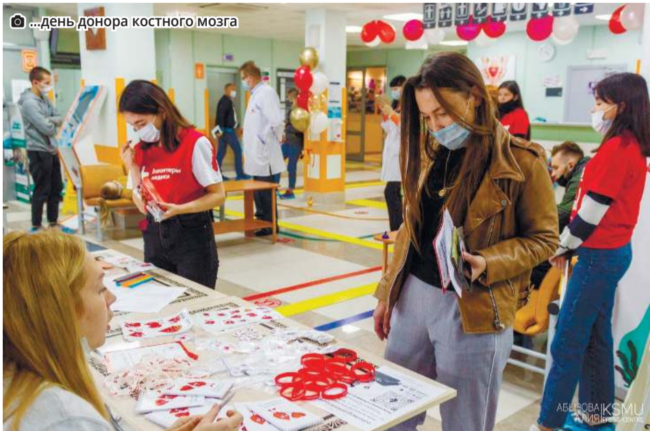
...день донора костного мозга