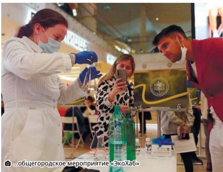
...общегородское мероприятие «ЭкоХаб»