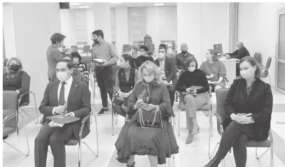
(Окончание на 5-й стр.)

Обеспечение нового качества научных знаний в области здоровьесбережения