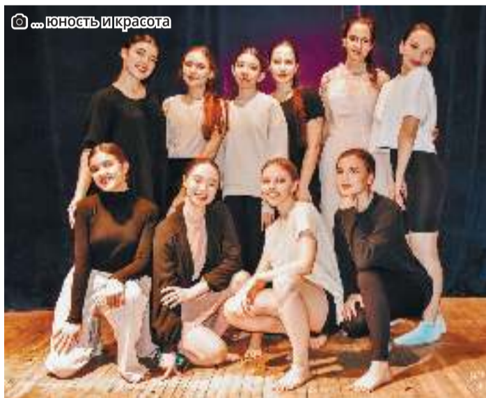
...юность и красота