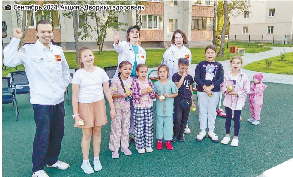
Сентябрь 2024. Акция «Дворики здоровья»