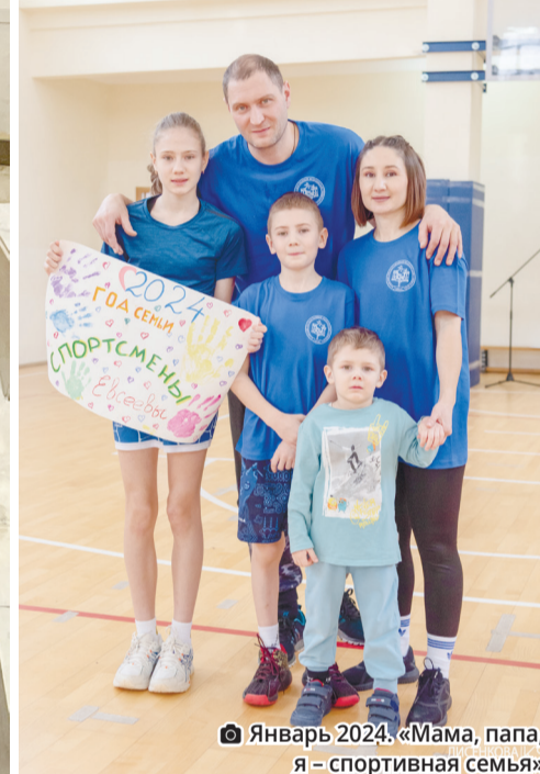
Январь 2024. «Мама, папа, я – спортивная семья»