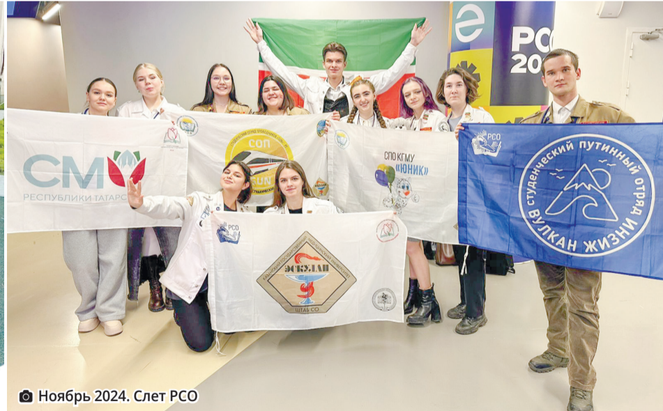
Ноябрь 2024. Слет РСО