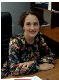
Виноградова Юлия Владимировна, директор Департамента по молодежной политике, социальным вопросам и развитию системы физкультурно-спортивного воспитания Казанского федерального университета