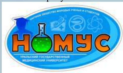
Рис. 1. Логотип научного общества молодых ученых и студентов УГМУ

Оформление рисунка представлено на рисунке 1.