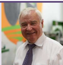
Ю.Ф. Лачуга, академик-секретарь отделения с.-х. наук РАН, академик РАН