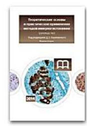
Теоретические основы и практическое применение методов иммуногистохимии