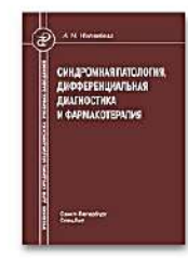
Синдромная патология, дифференциальная диагностика и фармакотерапия