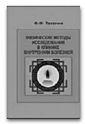
Физические методы исследования в клинике внутренних болезней