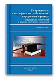
Современные классификации заболеваний внутренних органов