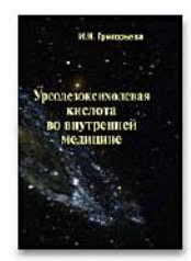
Уродезоксиколовая кислота во внутренней медицине