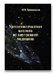
Урсодезоксихолевая кислота во внутренней медицине