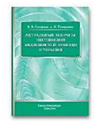
Актуальные вопросы неотложной медицинской помощи в терапии

- Теперь Вы прикреплены к институту и имеете доступ к подпискам института и к полному функционалу своего личного кабинета.