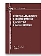
Синдромная патология, дифференциальная диагностика и фармакотерапия