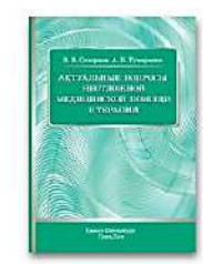
Актуальные вопросы неотложной медицинской помощи в терапии

- Вы имеете доступ к подписке института и к полному функционалу своего личного кабинета из дома или другого места.