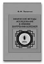
Физические методы исследования в клинике внутренних болезней