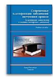
Современные классификации заболеваний внутренних органов