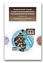
Теоретические основы и практическое применение методов иммуногистохимии