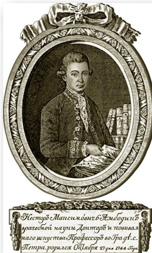
Нестор Максимович Максимович-Амбодик (1744–1812)