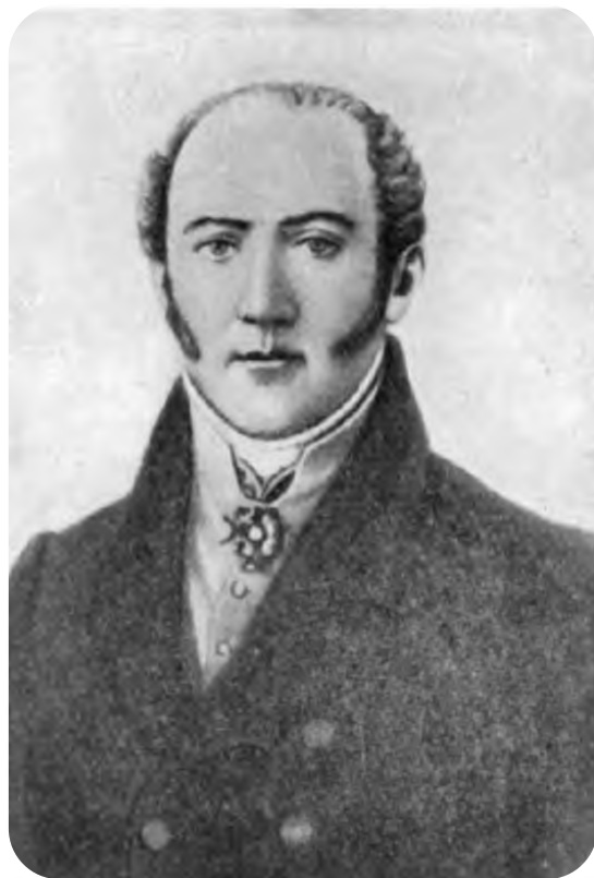
Семен Герасимович Зыбелин (1735–1802)