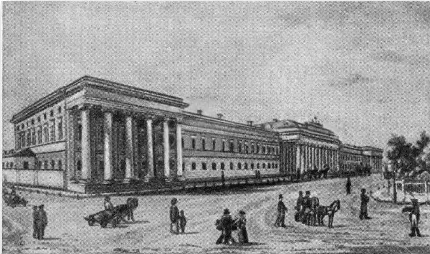
Казанский университет в середине XIX века.