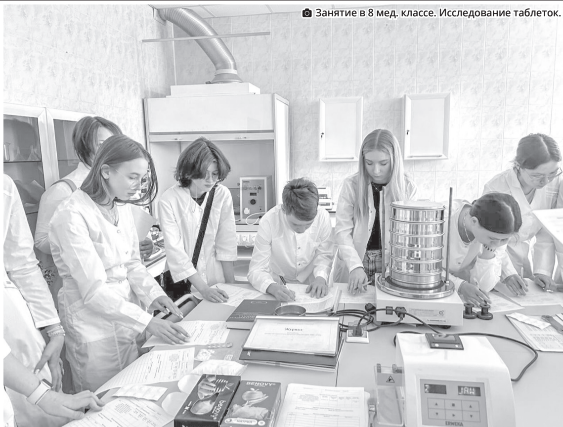
☑ Занятие в 8 мед. классе. Исследование таблеток.

В этом учебном году на отделении довузовского образования обучается 1017 школьников, из них 734 человека – в тридцати четырех медицинских классах на базе Гимназии № 139, Гимназии № 179, Лицея № 116, Лицея № 186, Лицея № 35, СОШ № 42, Полилингвального комплекса «Адымнар – путь к знаниям и согласию» г.Казани, Лицея № 1 г.Зеленодольска, Лицея имени Булатова г.Кукмор, СОШ № 20 г.Альметьевска, Лицея № 78, СОШ № 19 и СОШ № 24 г.Набережные Челны, Гимназии № 1 г.Чистополя, Лицея №