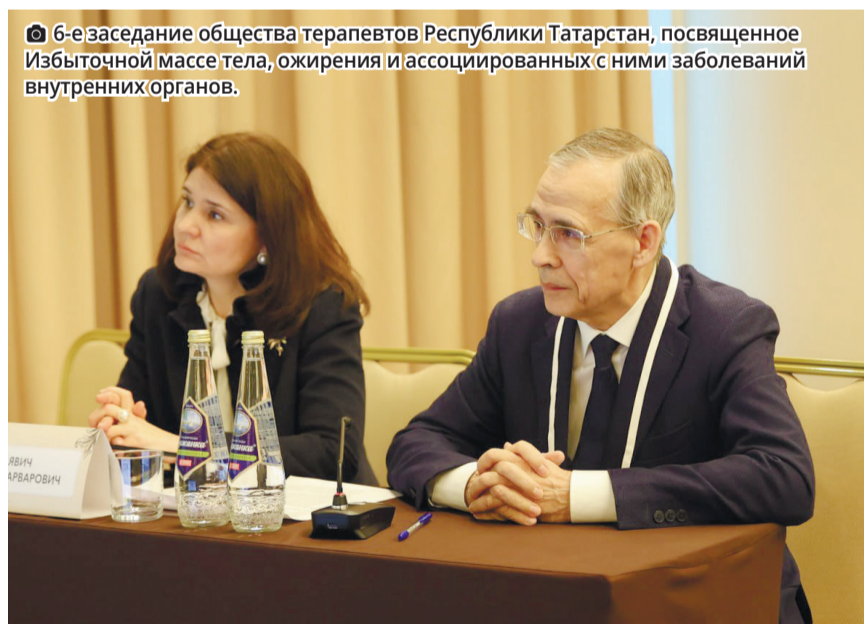
6-е заседание общества терапевтов Республики Татарстан, посвященное Избыточной массе тела, ожирения и ассоциированных с ними заболеваний внутренних органов.