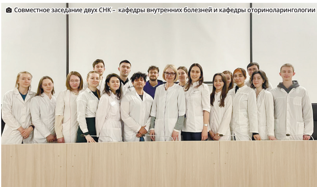
Совместное заседание двух СНК – кафедры внутренних болезней и кафедры оториноларингологии