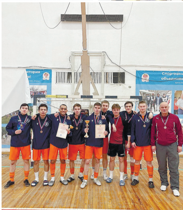
Сборная команда Казанского ГМУ стала бронзовым призёром соревнований по футзалу среди студентов медфарвузов Приволжского федерального округа.