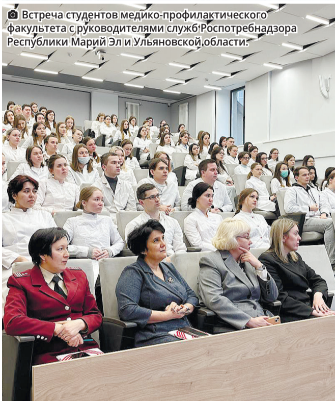
Встреча студентов медико-профилактического факультета с руководителями служб Роспотребнадзора Республики Марий Эл и Ульяновской области.