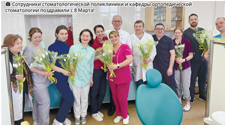
Сотрудники стоматологической поликлиники и кафедры ортопедической стоматологии поздравили с 8 Марта!