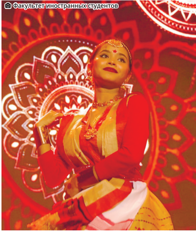
Факультет иностранных студентов