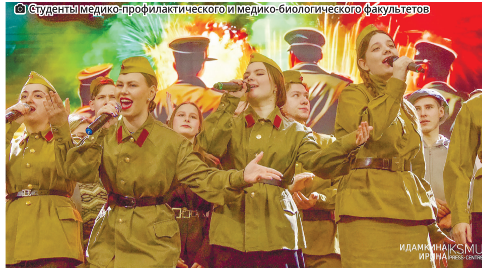
Студенты медико-профилактического и медико-биологического факультетов