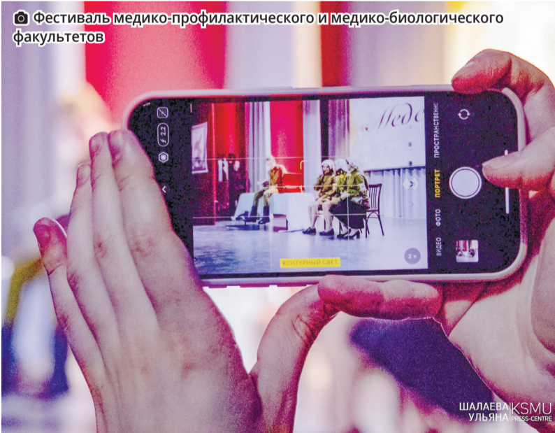
Фестиваль медико-профилактического и медико-биологического факультетов

Казанский медиКий Газета «Казанский медик» основана в 1934 году Учредитель – ФГБОУ ВО «Казанский государственный медицинский университет Минздрава России» Адрес редакции и издателя: 420012, г. Казань, ул. Бутлерова, 49, КГМУ Тел. (843) 236-12-94, +79600335750. e-mail: press@kazangmu.ru Редакционная коллегия: Председатель – ректор Алексей Станиславович Созинов