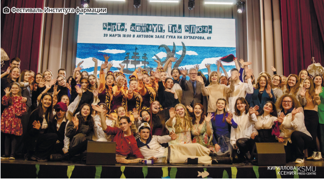
Фестиваль Института фармации