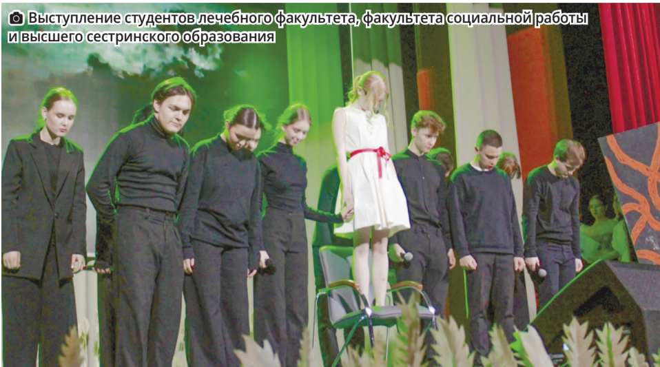
Выступление студентов лечебного факультета, факультета социальной работы и высшего сестринского образования