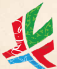
Министерство здравоохранения Республики Татарстан