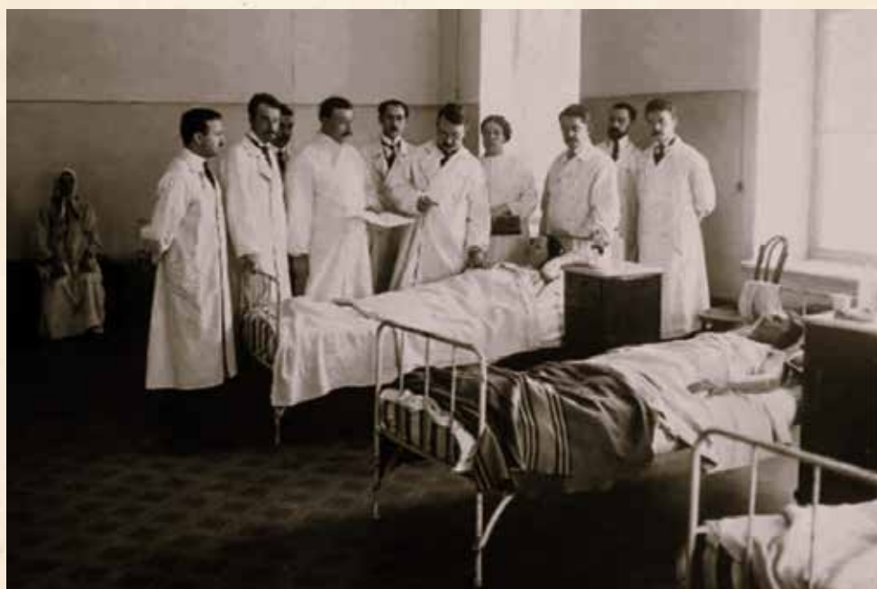
Родильный дом В.С. Груздева