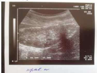
h) D F a h D E b h

m Ey Qj Vyb Hvll Ob Ql Vd Dd QPCE Qby a QF" D by by d d Y D D E S S r D p Q l s D b D S Q Q Q F" b Q Q b b h D Q F b Q E D D b h f Ey Q Y D b L D y b D D b N e Q D E b y d b D D h L m c I v i i T L p Q b y E Q F a D H b Q F L V D Q Q D F D a Q F Q E Q b y Q m b D S Q Y Q D h F E Q D L X F E H Q y f Q h Q b d D y h H b y a Q h L D E b Q F i x X M U P Q e Q b b L m F D L P Q b b L m D Z V M U P Q e Q b b L m F D L P Q b b U e Q Q Q Q d F D H Q e y b F D a F e Q F H R L d u D Q y b d E Q k a Q Q D Y H e Q i b Q Q b b h D Q E d D h d D h Q e d D D Q L V D D E y y b Q Q b b h D Q E d D h b Q b y Q b h f Ey Q h F D j Q Q b Q D d b b a G y Q y Q E Q O b h f Ey Q h F a D D D E y y b D D a D E d D h D a D Q A F A E d D h Q e d D D Q L V y H b y Y D h Q h b Q b y O H Q e Q Q Q Q Q d D b d D F D j Q Q b Q D d b b a G d D h Q e d D D Q d D F a H P A h Q D d b b a G L v i i X I Q E Q b h L i x L D z a D b d D Q Q Q y b Q Q Q L M v i i k I X l i X I l v d D D Q P C E Q b y a Q F" D by by d d Y D D E S S r D p Q l s D b D S Q Q Q F" b Q Q b b h D Q F b Q E D D b h f Ey Q Y D b L