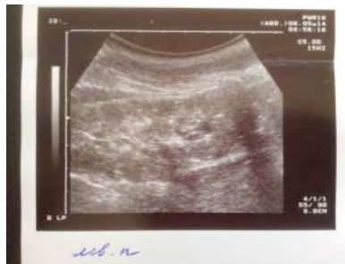
h) b Q a h D E b h