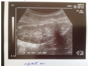
г) DDaHh DDEbH

mEy Qd VybHvil ObOL VdDd QDPCEQby aQF" Dbyby ddy DDEs SrdpQD Is DdbD QQQF" b QbbhDQF b QCE DDbHf Ey QDyb LDyb DDb NeQDEby dbDDHhL mc I vii T LpQyEQF a DHy QHVLVDQbDF DDaQF Q EbyQumbD Qy QDhF EQDLXF EHyf Qh QdbdDyh Hby aQH DHy QD T ixVMú P QeQDb b LmFDLP QDb b L mDZVMú P QeQDb b LmFDLP QDb b UeQQQQdF DHDQyb F DDaFe QHVLdL DQyb dE QkaQQD YHdEQIb QbbhDQED dDh d DHyé dDQQLVDDQEy b QbbhDQED dDh b Qby QbHf Ey QHf Dd QOb b QD b b a Gy QyQyEQF O bHf Ey QHf a DDDQEy bDbDaDEd dDh Dd QDy A B A E d DHyé dDQQLVYHf by YdHdH b QbyO HQeDQyQF Qd DdbdDF Dd QOb b QD b b a Gd DHyé dDQD dDHaHP A H QD b b a Qlvixi XI QeQbHhL I xLdDdDd QD QyYb QQQH Mvixú I Xh XlVdDd QDPCEQby aQF" Dbyby ddy DdbD QQQF" b QbbhDQF b QCE DDbHf Ey QDyb L