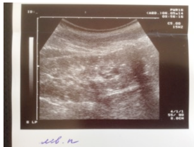
д) bQaHh DDEbH