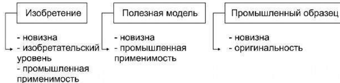
Рисунок 1. Критерии патентоспособности

Результаты анализа условий патентоспособности необходимо привести в табличной форме (табл. 1-3).